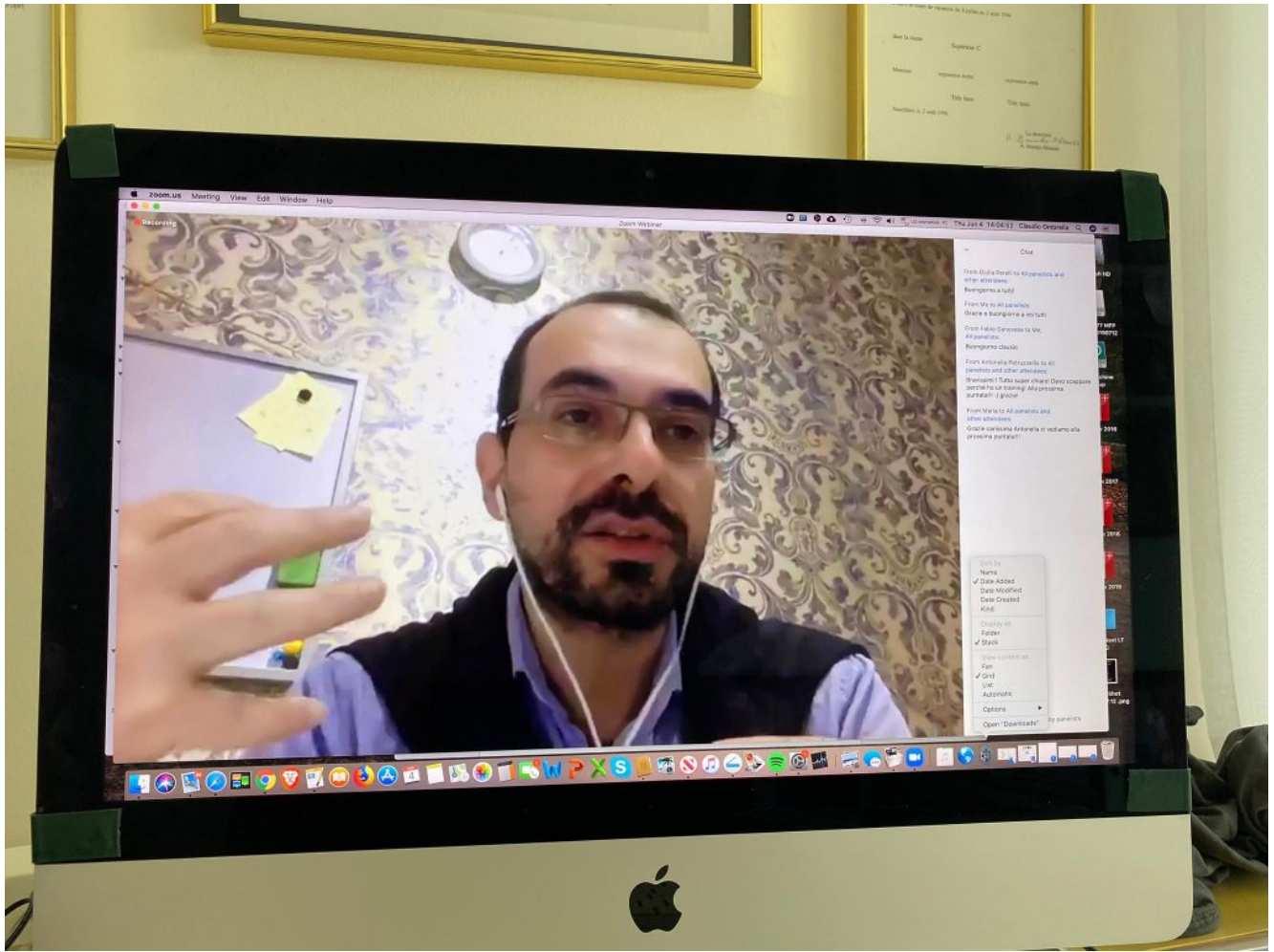
Con la barba post-Covid che presento i primi argomenti