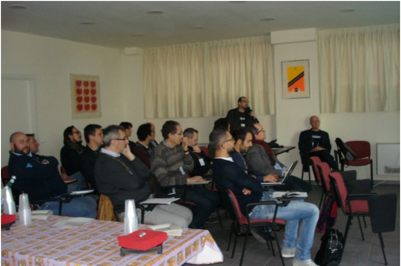
Atlassian User Group