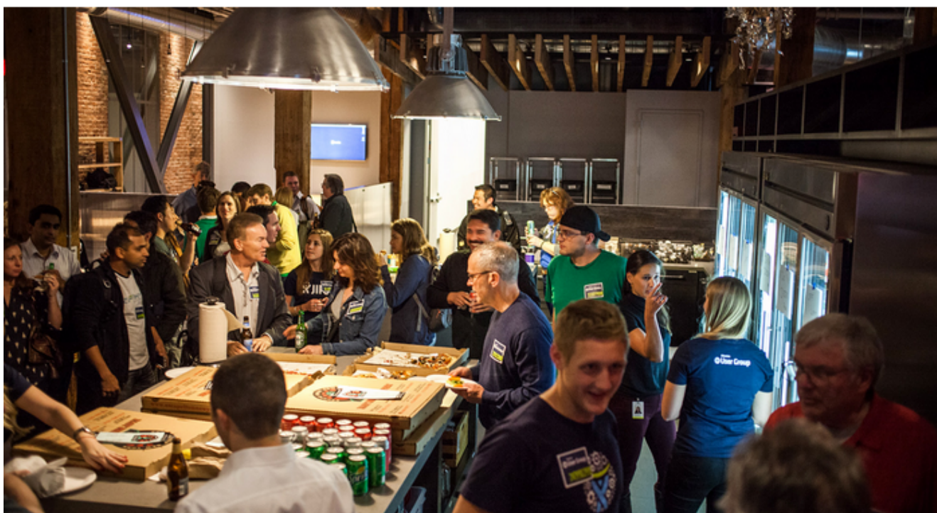
Atlassian User Group

In questo post riassumiamo brevemente l'incontro del primo AUG (Atlassian User Group) che si è tenuto a Bologna il 24 marzo 2016 .